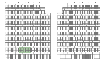
ALÇADO TARDOZ | ALÇADO PRINCIPAL