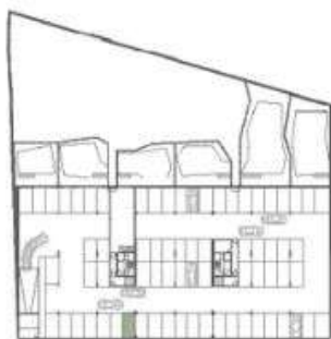
Planta piso -1