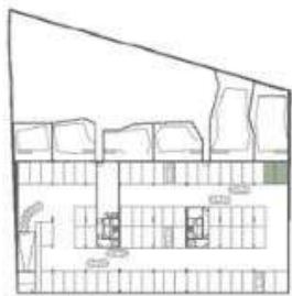
Planta piso -1