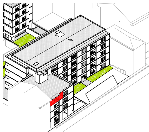
Alçado Principal (Poente)