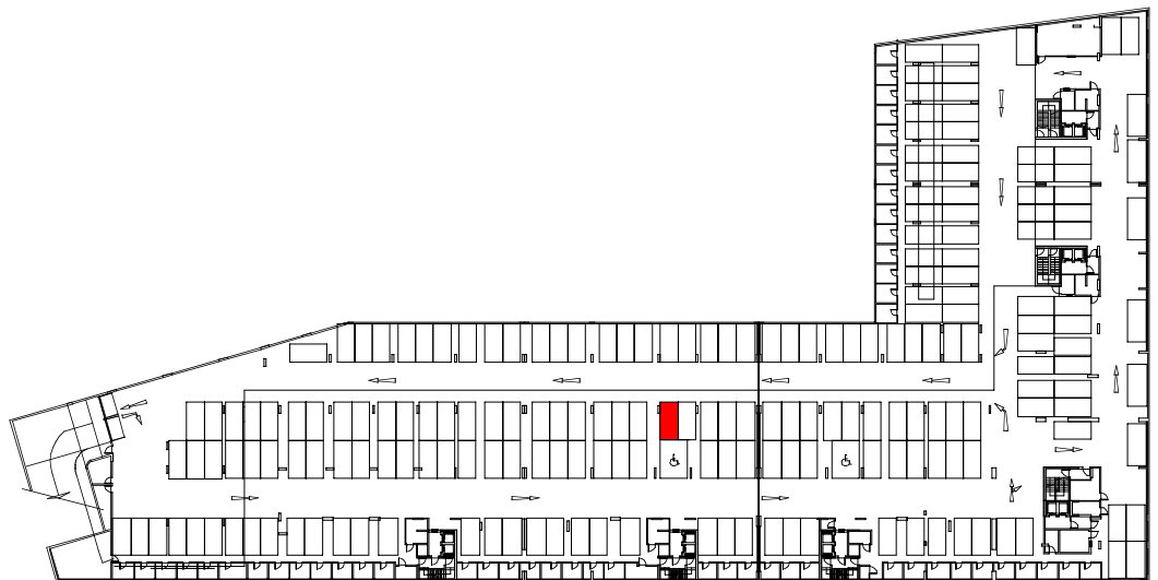
PLANTA ESTACIONAMENTO PISO -1