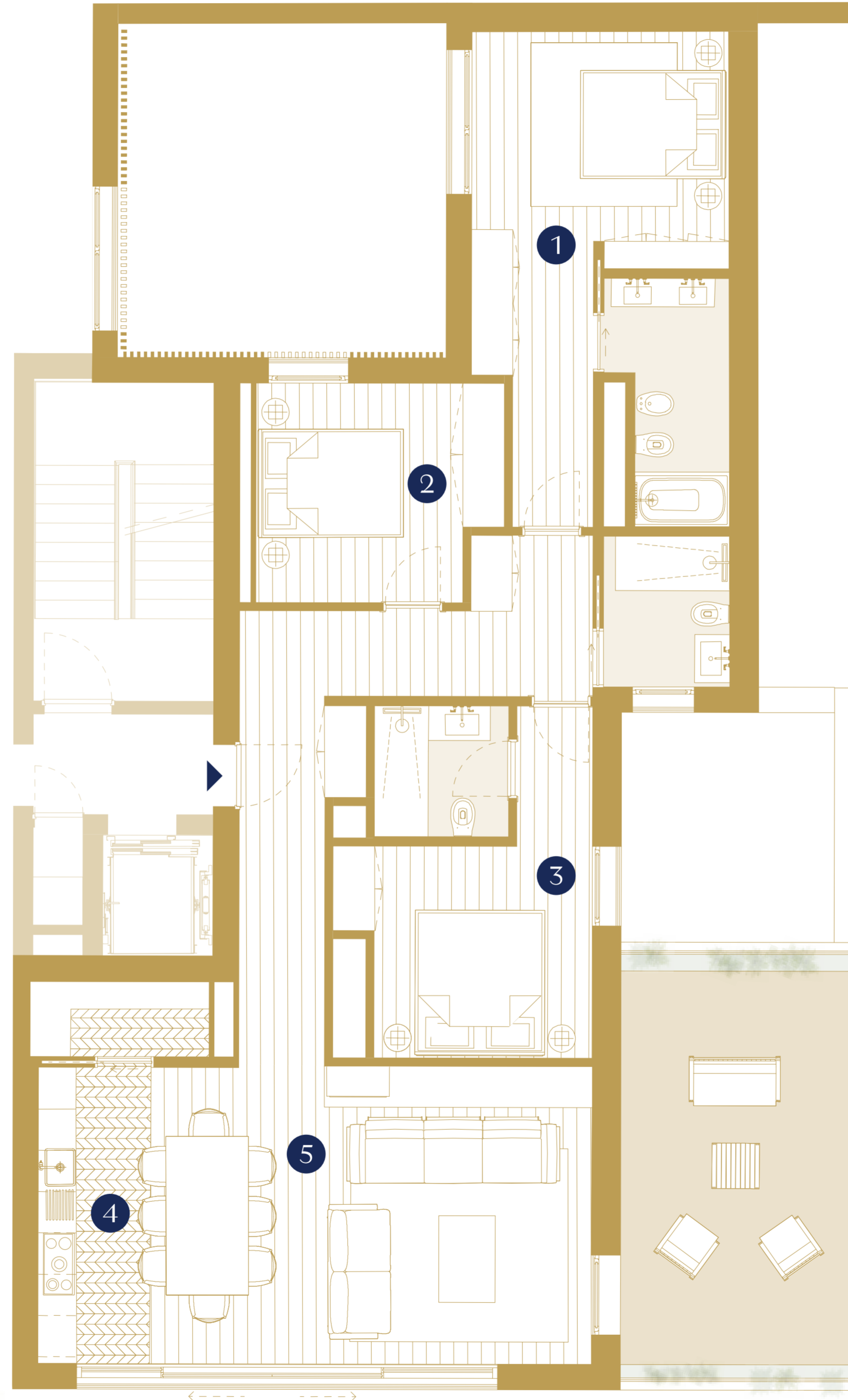
First Floor | Piso 1