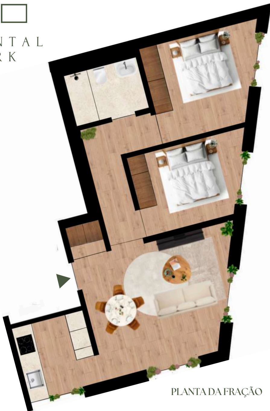
PLANTA DA FRAÇÃO