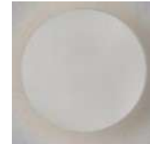
Aplic paret exterior