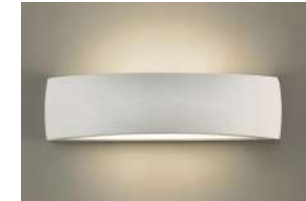
Aplic paret interior